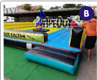
Barredora Wipe Out